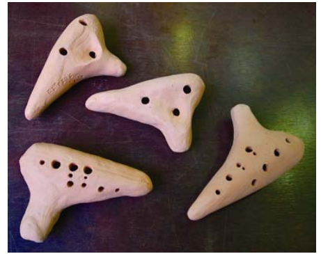
完成した作品の一部