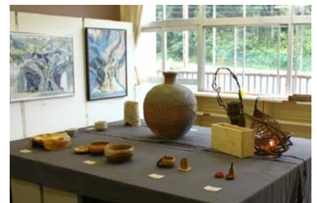
旧教室内の展示風景 (2012)