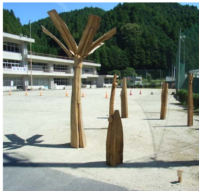
校庭に立つ野外彫刻 (2013)