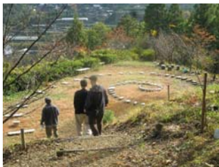
(神山AIRのアートツアー)