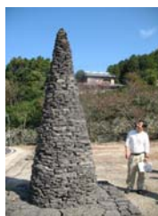
(アスファルト片を材料に)