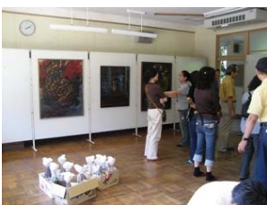
(展示にもお喋りにも熱中!!)