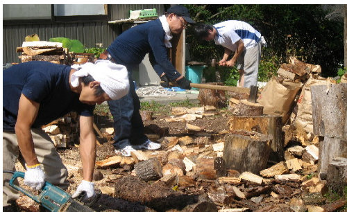
(薪割りに励む参加者の皆さん)

予定していた9月21日と10月18日に加え、10月17日・11月21日・22日にも「薪割り」を実施しました。おかげ様で、約550束の薪の用意が完了。木っ端の袋詰めもたくさんできました。ご協力、ありがとうございました。この大事な薪に、屋根がほしいところですが、予算の都合上、波板を載せることになりました。