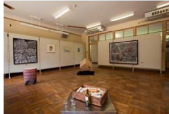
(多種多様な立体と平面作品)