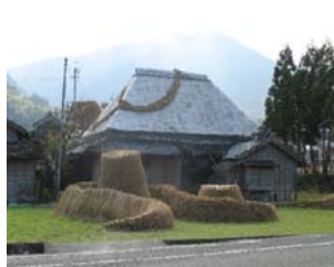
(稲藁と藁葺き民家のマッチング)