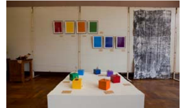
(カラフルな平面と立体作品)

'09「風と土のかたち」展は、地域の方々の協賛を得て、出品者 65 人、作品点数約 110 余点の充実した展覧会となりました。伊賀上野ケーブルテレビ、朝日新聞、読売新聞、中日新聞等にも報道・掲載され、遠くは名古屋、京都や大阪など、遠方からの方々も含め、地元の伊賀市や名張市から多数のご来場を頂き、入場者数も昨年の倍近い数となりました。伊賀地域(伊賀市、名張市)在住の作家の方々の絵画、彫刻、染織、陶芸をはじめとした作品群、地元の矢持地区の陶芸及び木工旋盤の同好会の方々の作品、「Artist in Residence at IGA」の参加作家、学生ボランティアや各種講座の講師や協力者の方々の作品、そして芸術系NPO法人としての本法人会員の多種多様な作品など、多くの方々の出品を得て、旧矢持小学校校舎の廊下、和室、教室などを使用し、素敵な作品達が語りかけてくる生き生きとした展覧会となりました。法人主催の展覧会も 6 回目となりましたが、ただ単に作品を持ち寄るだけの展覧会ではなく、参加者自身が各々の作品を紹介するギャラリートークや交流会を兼ねたオープニングパーティも行ないました。真剣な意見交換を通じて、作品制作についての意図や工夫した点など、貴重な話も伺うことができ、皆様方の「ものづくり」が「ひと」と「ひと」を「つなぎ、ひろげる」、そんな交流を通じた「交換・交歓・好感」の場面・空間であったことを実感することができました。また、地元の同好会主催の木工旋盤、法人主催のフェルトやステンドグラスの造形体験コーナー、工房山帰来の卓上機の講習や照々庵のお茶席などもあり、来場者に変大好評でした。作品の内容についても、ご観覧頂いた多数の方々から、水準の高い作品群であるとのお声や回を重ねるごとに充実・向上しているとの評価も多く頂きました。今後も、今までの経験を活かしつつ、より充実した展覧会を開催していきたいと願っております。来年も、多数の方のご出品・ご参加をお待ちしております。