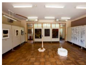
(AiR 参加作家や講師の方々も出品)