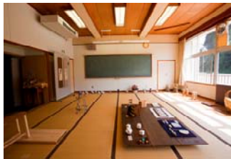
(和室の工芸作品等)