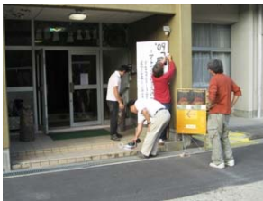
(出品者自ら玄関前に看板設置)