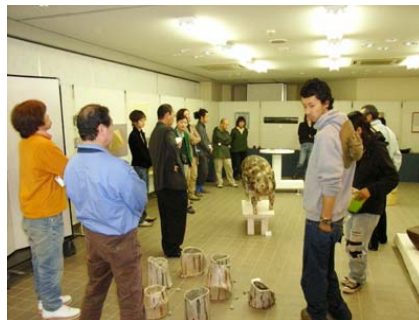
搬入時の自己紹介