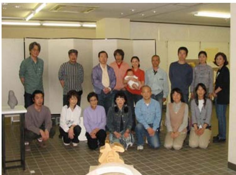
搬出時の出品者の方々

5/14(日)～21(日)、2年ぶりの展覧会『風と土のかたち』展が青山公民館1階ロビーで開催されました。第1回は『はるのかたち展』、第2回は『風のかたち展』、そして今回、『風と土のかたち』展となりました。