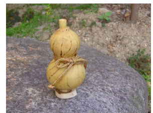
七味入れ(立田氏作)

制作後は、地元の方が撃たれた猪の鍋を堪能しました。猪だけでなく、なんと鹿肉も！しかもお刺身で、です。新鮮な肉に舌鼓を打ちながら、お酒もおしゃべりも、つつい進んでしまう、身も心も暖くなる夕餉でした。